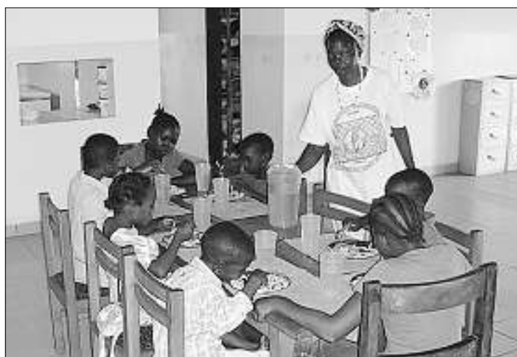
Bildung, Gesundheit und ausgewogene Ernährung als Grundsatz: In der «Casa Luan» wohnen derzeit 10 Kinder.

www.uniquedirect.org, PC-Konto: 85-337501-6